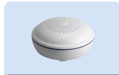
WA360F Art.Nr. 10 113