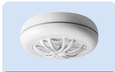
HA360F Art.Nr. 10 112