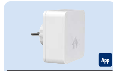
SW360F Art.Nr. 10 114