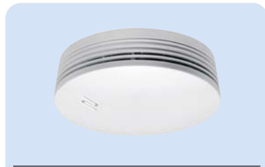
RA360F Art.Nr. 10 111