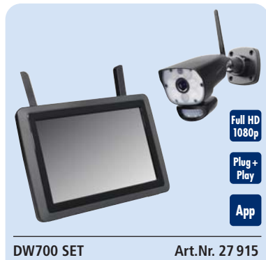
DW700 SET Art.Nr. 27 915