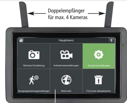
9 Zoll Touchscreen-Monitor (sichtbare Diagonale 22,8 cm)